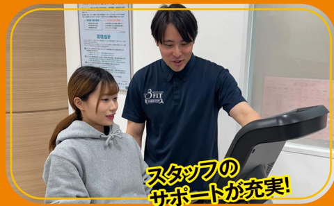
スタッフの サポートが充実!