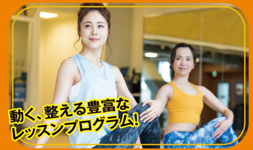
動く、整える豊富な レッスンプログラム!