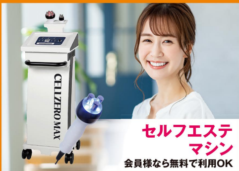
セルフエステ マシン 会員様なら無料で利用OK