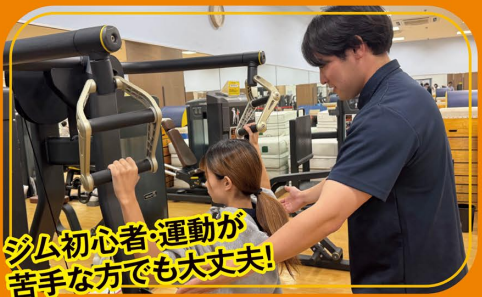
ジム初心者・運動が 苦手な方でも大丈夫!