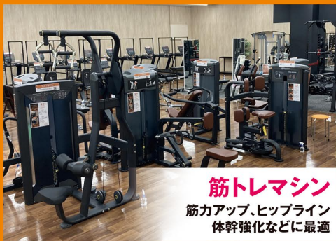
筋トレマシン 筋力アップ、ヒップライン 体幹強化などに最適