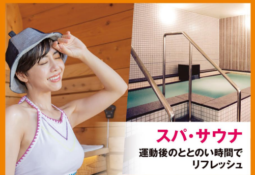
スパ・サウナ 運動後のととのい時間で リフレッシュ