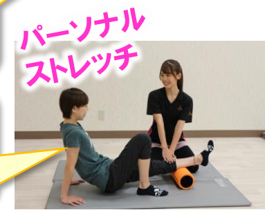
パーソナル ストレッチ