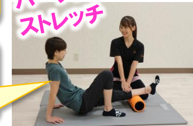
パーソナルストレッチ