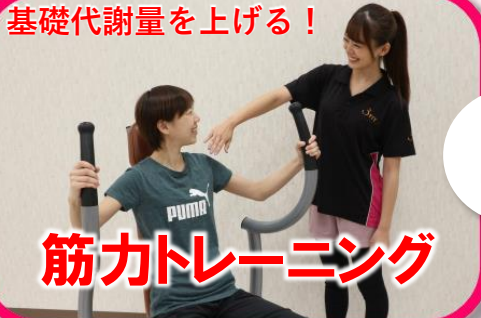
筋力トレーニング