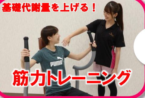
筋力トレーニング