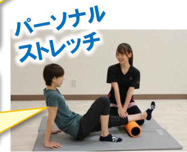
パーソナル ストレッチ