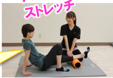
パーソナルストレッチ